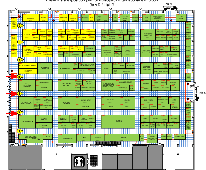
Предварительный план экспозиции международной выставки «RosUpack 2012» / Preliminary exposition plan of RosUpack international exhibition Зал Б / Hall B

Легенда / Legend: GRUPack Гибкая упаковка для упаковки / Flexible packaging production equipment